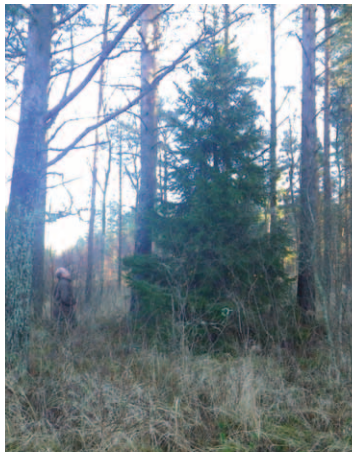
Kuusepuu metsas "kolimist" ootamas.

“Loodetavasti soosib puu kasvaminekuks nii hea ilm kui ka inimeste jõulumeelne käitumine ja me ei pea kuuske uuesti püsti aitamagi nagu juhtus eelmisel aastal mitmeski kohas mujal,” ütleb Mäeküngas.