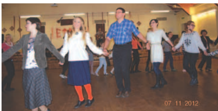
Peo viimane tund kujunes elavaks tantsupeoks, kus jalga keerutada sai igaüks.