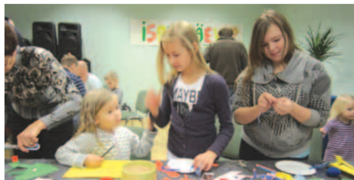
Loo kultuurikeskuses toimunud isadepäeva perepäeval said lapsed oma isadele kingitusi meisterdada.

Avatud olid hubane kodukohvik, kus sai sümbolise raha eest nautida spetsiaalselt selleks päevaks valmistatud värsket kohvikukraami. Avatud oli ka meisterdamisnurk, kus emmed ja lapsed said päevakangelastele kingitusi meisterdada. Päeva tippheteks oli humoorikas teatriendus "Piip ja Tuut köögis", mis pakkus naeru ja mõnusat teatrielamust kogu perele. Ka sel kultuurikeskuse üritusel tuli välja tuua lisatoolid, mis ürituse korraldajaid muidugi väga rõõmustas.