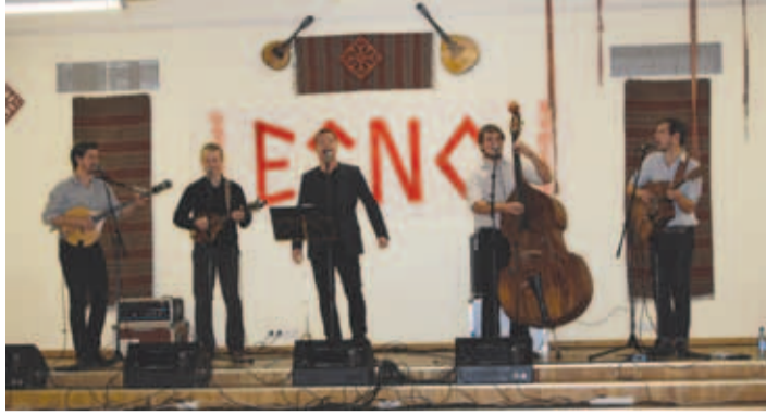
Ott Lepland koos ansambel Gjangstaga laval.