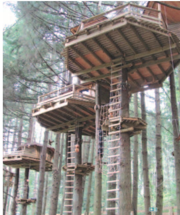
Lyonist pooleteise tunnise bussisõidu kaugusel asuvast kaevanduspiirkonnast on saanud imekaunis ajal hektaril laiuv puhkeala. Ööbida saab seal spetsiaalsetes majakeses, mis asuvad kümne meetri kõrgusel põlispuude latvades.

Säästvat eluviisi propageeriv teavitussprogramm võiks olla kasutatav meilgi: inimestele