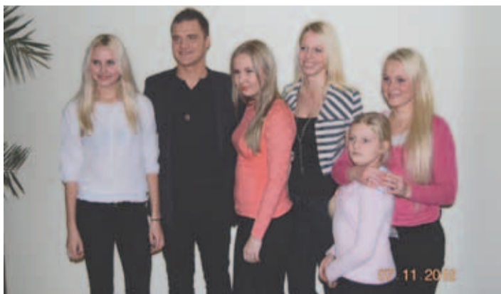
Nii mõnigi etnopeoline soovis pilti koos superstaar Ott Leplandiga.