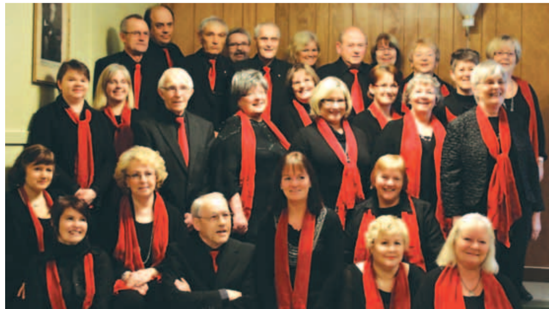
Mai lõpus võõrustas Kostivere kultuurimõisa segakoor Norrast pärit segakoori Odal Bygdekor.

Loomulikult ootab Kostivere kultuurimõisa segakoor enda ridadesse ka uusi liikmeid. Tuleb ainult kohale tulla kolmapäeva õhtul kell 19 mõisa saali.