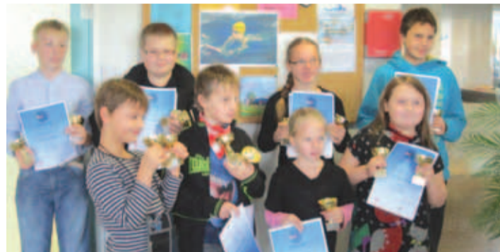
Pildil on selleaastased ujumisvõistluste võitjad, kes läksid koju rõõmsate emotsioonide ja uhkete karikatega.