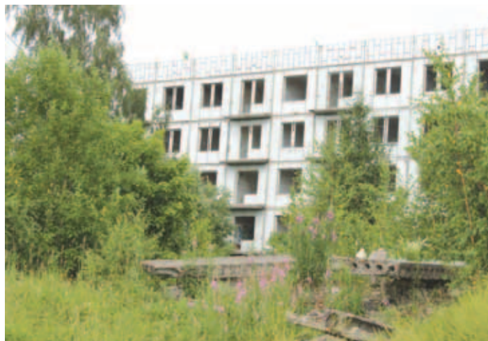
Jägala linnakut järgneva kümne aasta jooksul ei rajata. Piirkonna lagunevad tondilossid jäävad edasi ootama, millal keegi nad lammutaks või midagi uut asemele ehitaks.

Jägala linnaku territoorium on ja jääb ka edaspidi Kaitseministeeriumi valdusse.