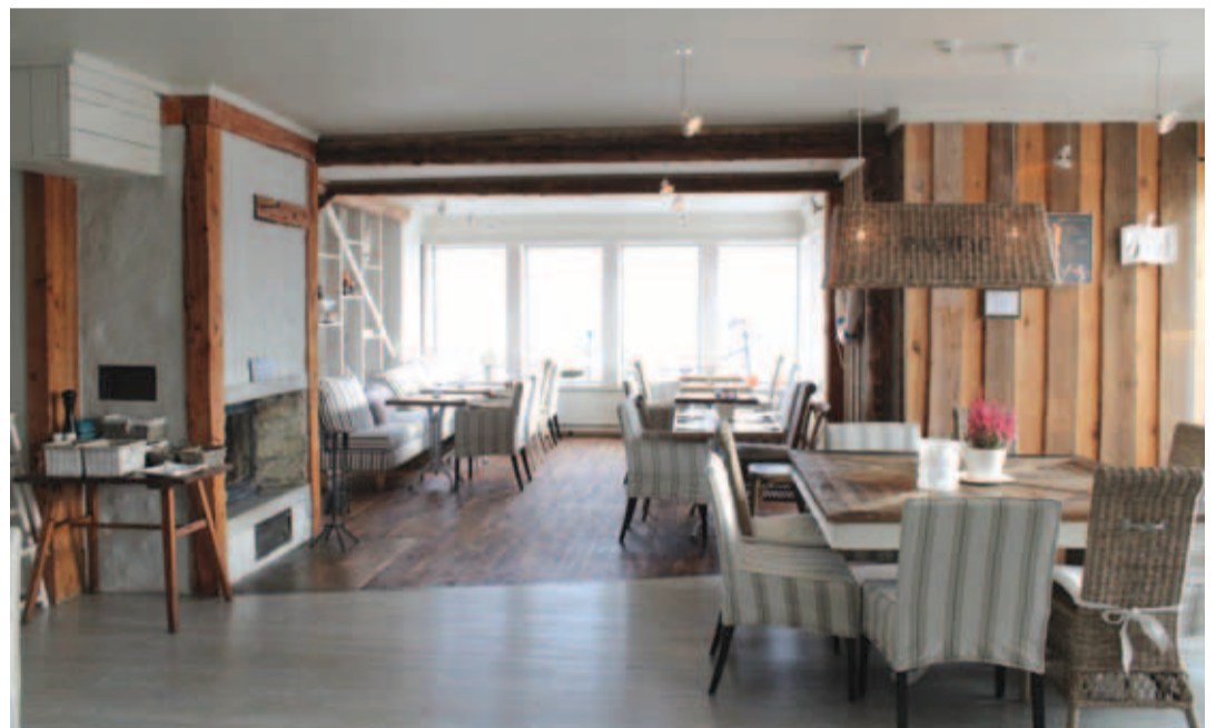
Sisustus OKO Restos on heledates toonides ja maitsekas, see ei tähenda aga seda, et sisse tohib astuda vaid ülikonnas või kleidis, vastupidi villastes sokkides ringijooksivad lapsed ja kodustes riietes täiskasvanud on siin täiesti igapäevane nähtus, millele viltu ei vaadata.